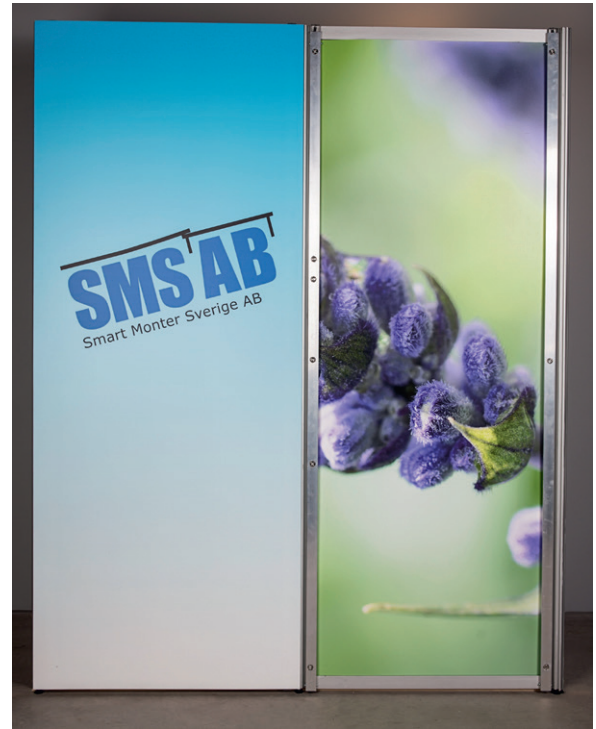
Schritt 2: Das erste Smart Reuse Board™ anheften