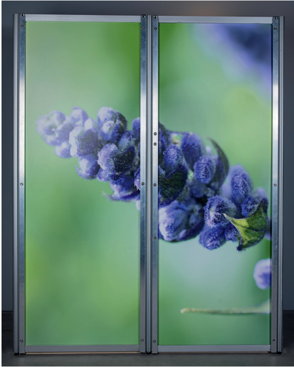
Schritt 1: Befestigen Sie den Smart Frame Remover™ auf dem Aluminiumsystem