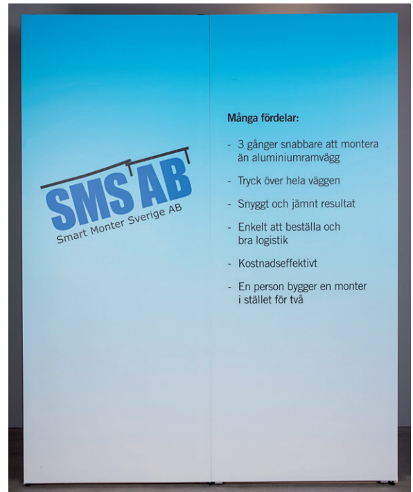
Schritt 4: Fertig montierte Posterwand